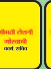
सीमली सोननी कार्य. सचिव