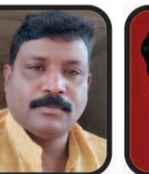
अक्वेष प्रधान महामंत्री