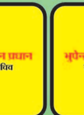
देवांगन प्रधान सचिव