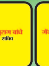
अनुराज चौधे सचिव