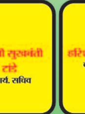
सीमली सुखवंती कार्य. सचिव