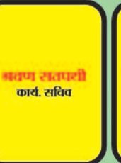
सतम सतपथी कार्य. सचिव