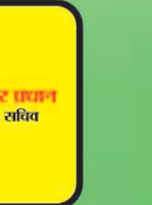
चमकेन्द्र प्रधान कार्य. सचिव