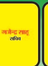
जगज्ज साहू सचिव