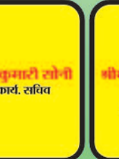
राजकुमारी सोरी कार्य. सचिव