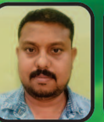
राधे सोन सचिव