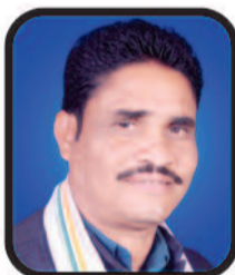
राजकुमार प्रधान उपाध्यक्ष