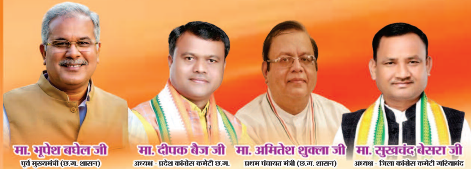
मा. भूपेश बघेल जी पूर्व मुख्यमंत्री (छ.ग. शासन)